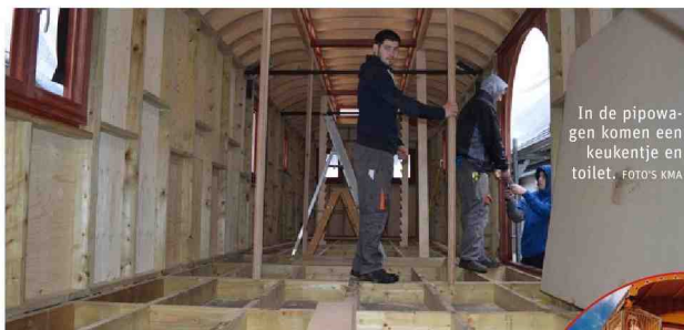
In de pipowagen komen een keukentje en toilet.